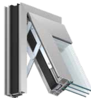
okno MB-86 Casement

Przykładowe współczynniki przenikania ciepła U_w